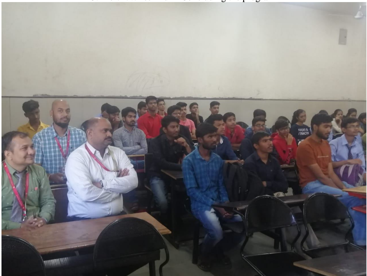
4. Students along with faculties