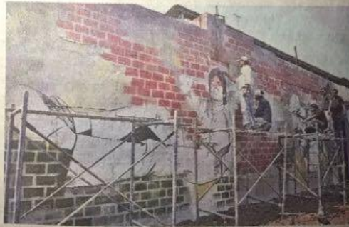
कलाकारांनीच सोसली झळ

◆ शहरातील मध्यवर्ती बसस्थानकाला नवे रूप देण्यासाठी हॅन्ड फाउंडेशनने स्वखर्चाने स्थानकाची रंगरंगोटी केली. चित्र रेखाटण्यापूर्वी बस बाजूला ठेवून या कलावंतांनी अगोदर संपूर्ण स्थानकाची साफसाफाई केली. यासाठी त्यांना तीन दिवस लागले. स्थानकातील दुर्गंधी आणि सांडपाण्याची परिस्थिती भुयावह असतानाही या तरुण-तरुणींनी आपल्या शहरासाठी हे काम हाती घेतले आणि स्थानकाला चित्र रेखाटण्यापर्यंत तयार केले. रंगरंगोटी केलेल्या भिंतीवर नंतर कॅलिग्राफी करण्यात आली. यासाठीचा लाखो रुपयांचा खर्च या चित्रकारांनीच केला.