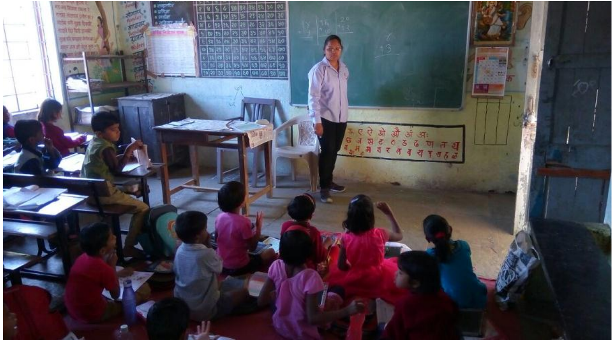
Photo: NSS volunteers teaching in ZP School

Teaching In ZP School : NSS volunteers conducted Drawing, Essay , Elocution such type of competition in ZP school Jategaon. Some students also taught English, Mathematics and some simple tricks to solve mathematics.