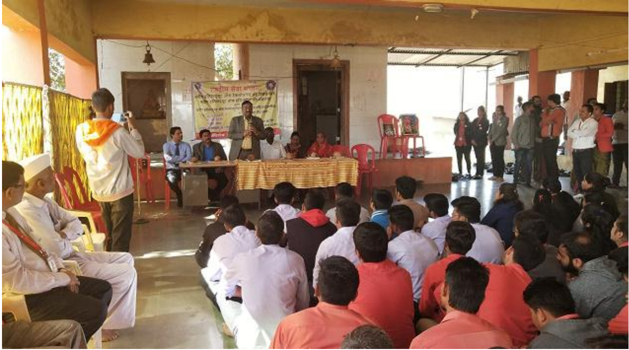
Photo Inauguration of NSS special camp 2018-19