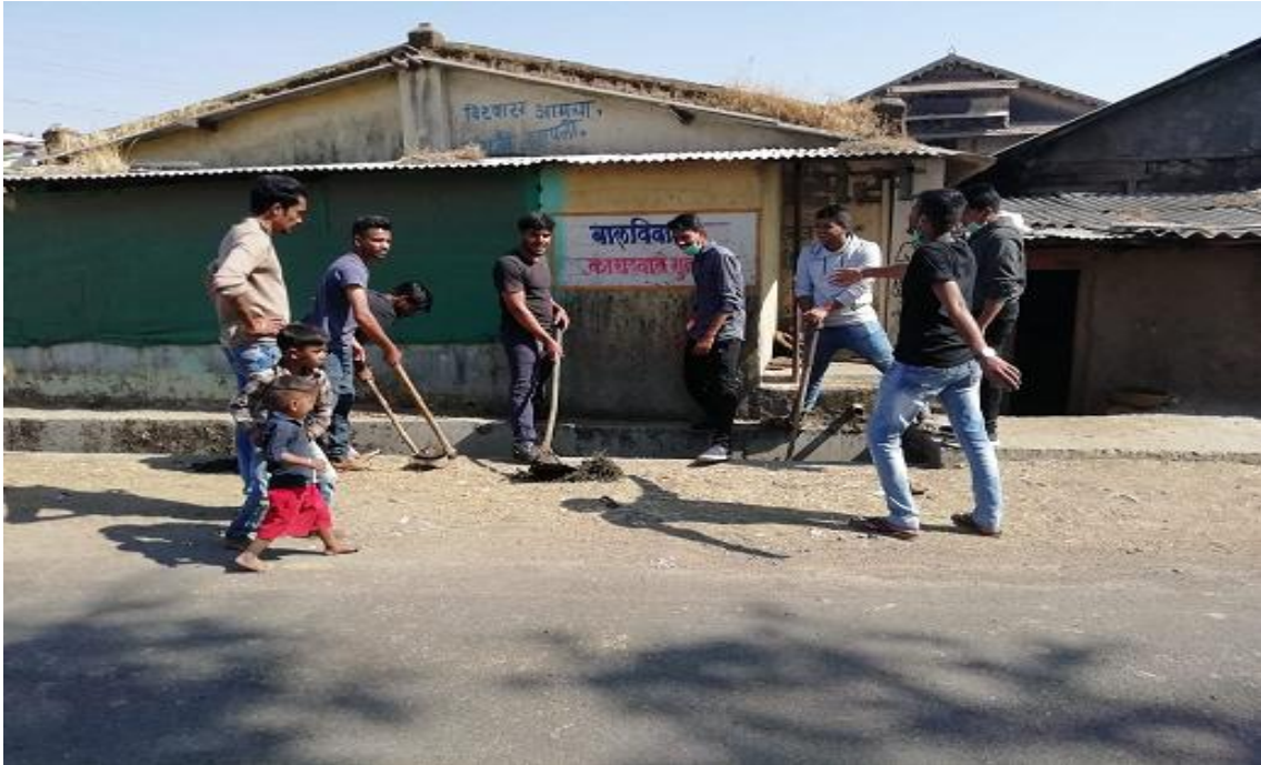
Photo: Waste Water Management