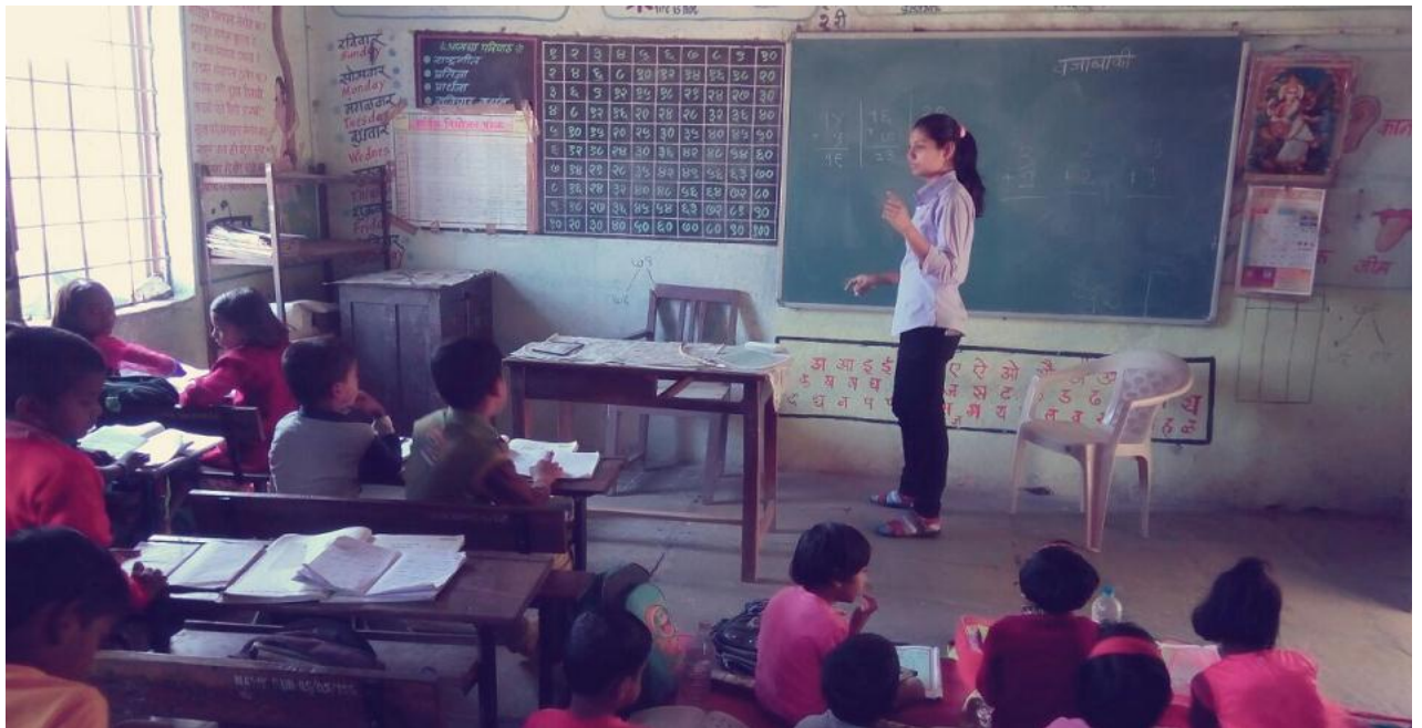
Photo: NSS volunteers teaching in ZP School