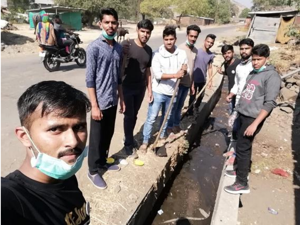
Photo: Cleanliness campaign

Cleanliness Drive: NSS Volunteers conducted Cleanliness Drive in the half part of the village Jategaon and also convinced villagers to maintain the cleanliness in the village.