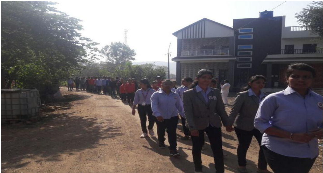
Photo: Rally in the village

Cleanliness Campaign: Awareness of cleanliness, road safety message was given through the rally in the village