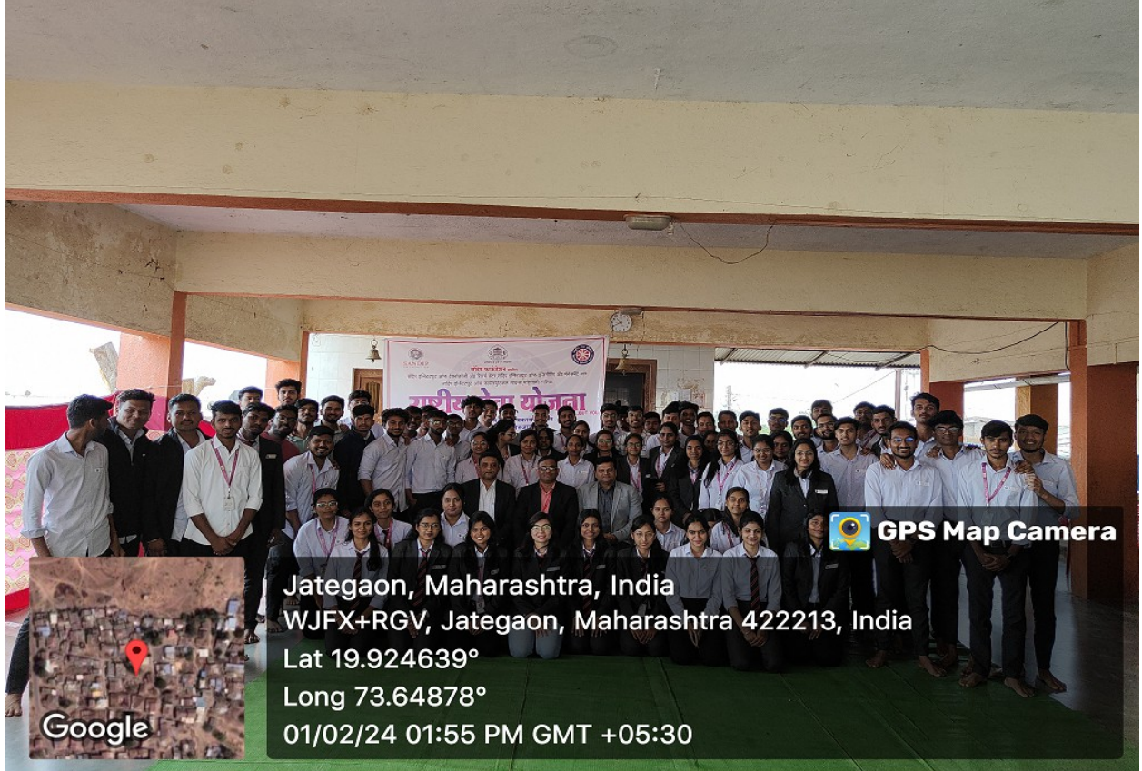
Group Photo: NSS