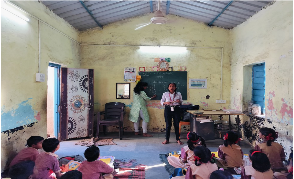
NSS volunteer teaching at ZP School Jategaon