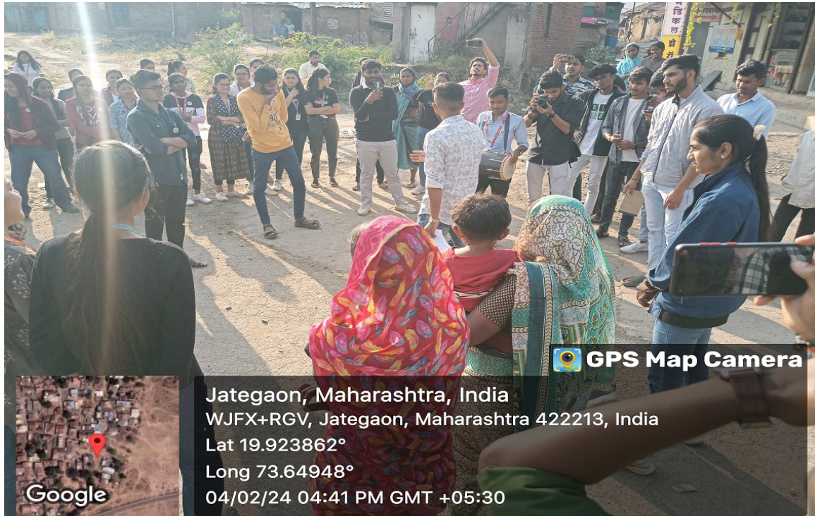
Street Play on Population Control