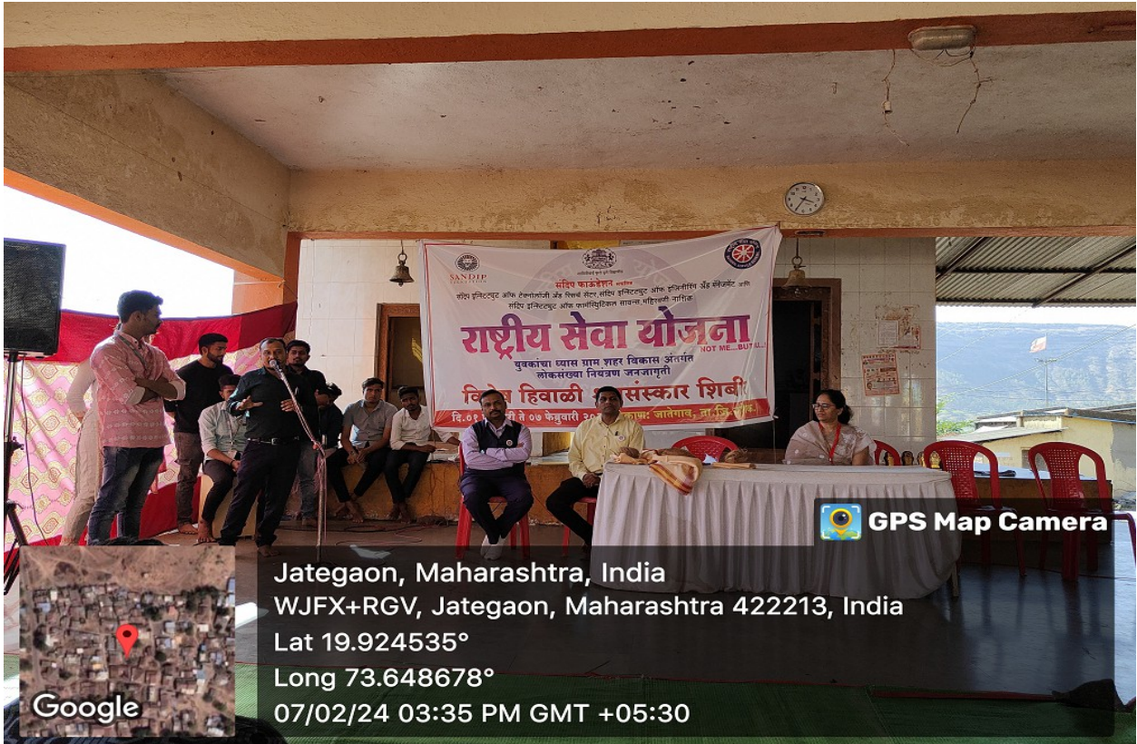
Valedictory function NSS Special Camp