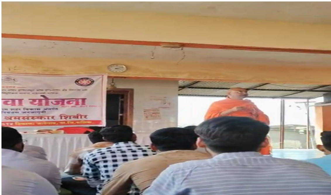
Swami Shrikathanand interaction with NSS volunteers

Session on Youth and Democracy - Session on youth and democracy was delivered by Shri Swami Shrikathanand ji.