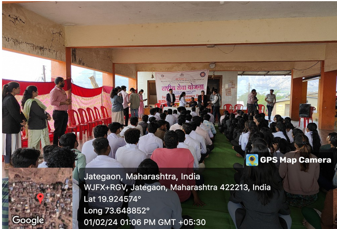
Photo Inauguration of NSS special camp 2023-24