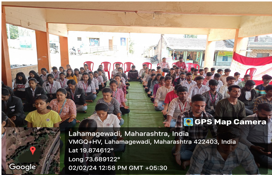
Session on meditation