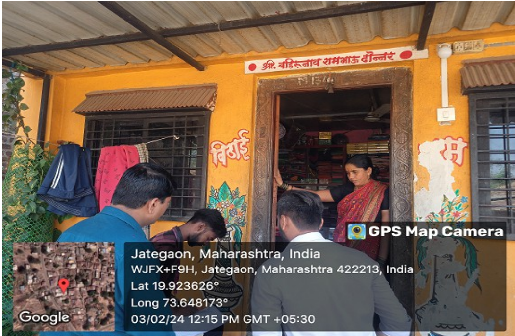
NSS Volunteers doing survey

Session on Youth and Democracy - Session on youth and democracy was delivered by Shri Swami Shrikathanand ji.