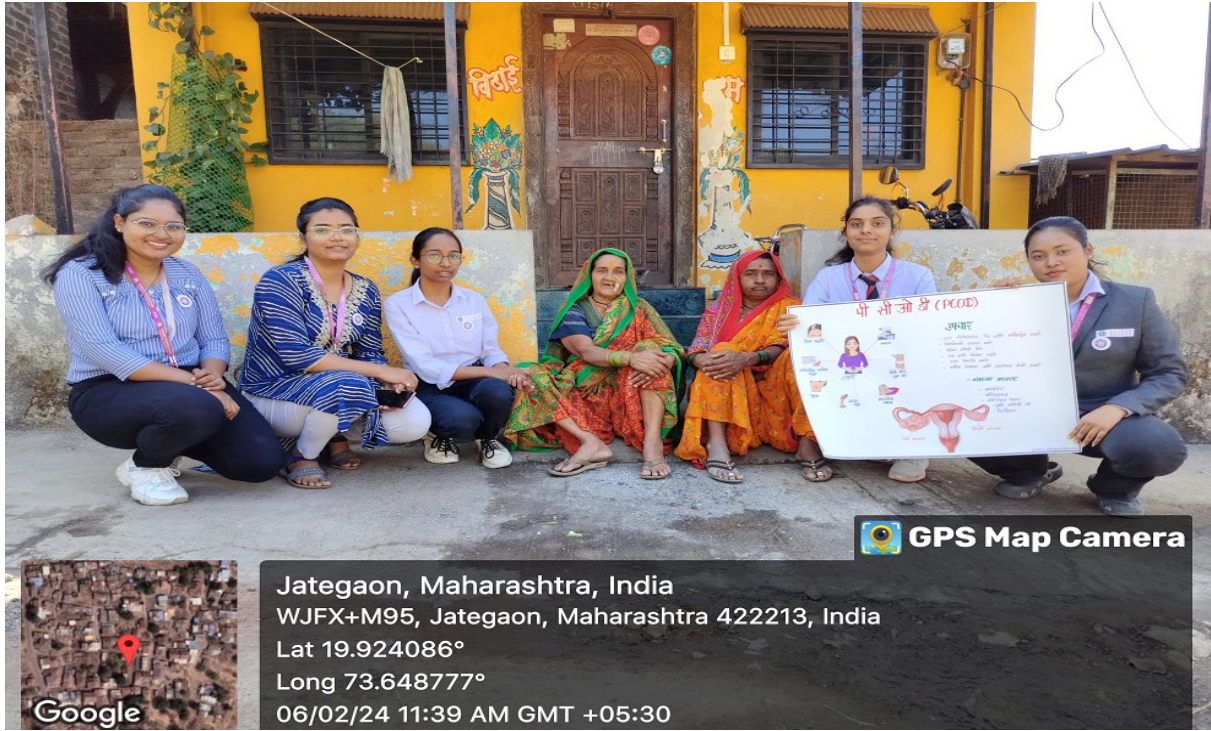
Free Health Check up camp

Jategaon, Maharashtra, India WJFX+RGV, Jategaon, Maharashtra 422213, India Lat 19.924684° Long 73.648763° 06/02/24 10:06 AM GMT +05:30