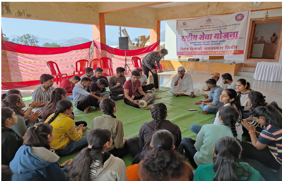
Student Activity- Bhajan