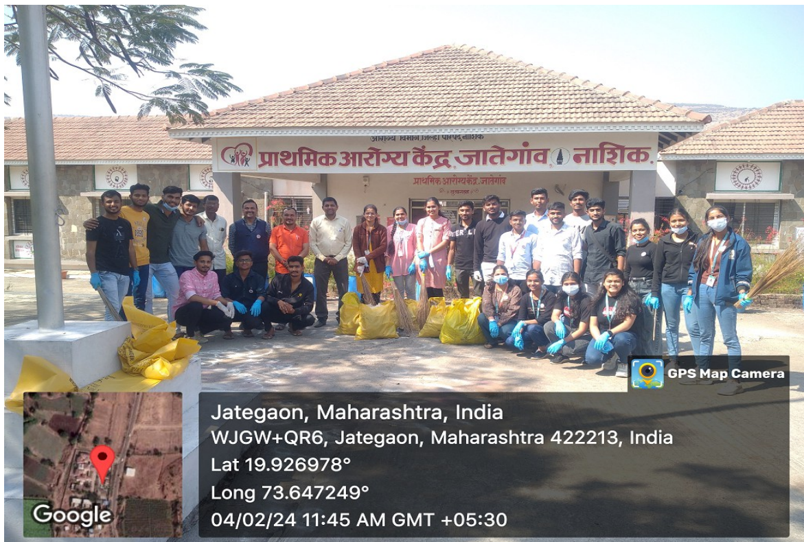
NSS Volunteers in involved in cleanliness drive