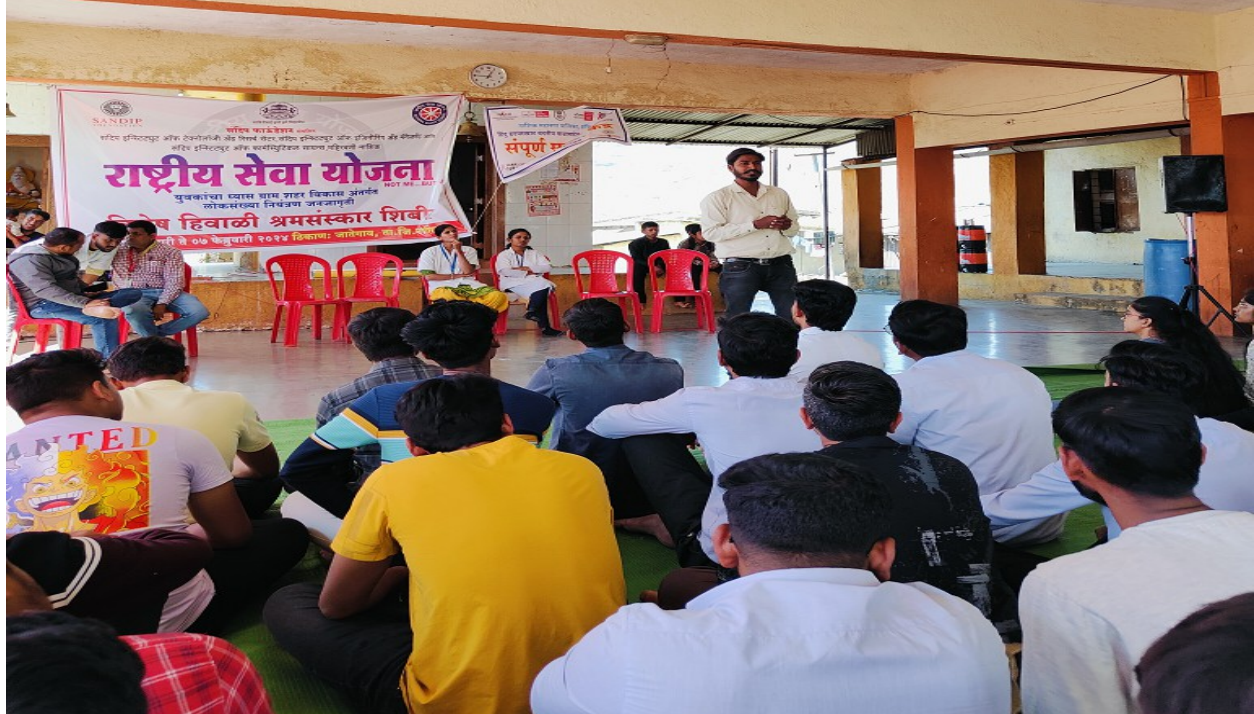
AIDS awareness session