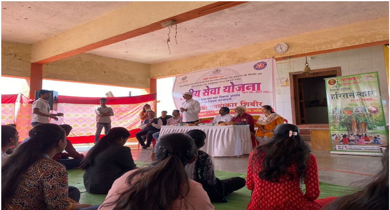
Session by Hirvankur NGO