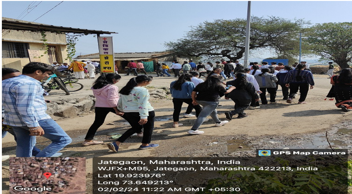
Rally on Cleanliness