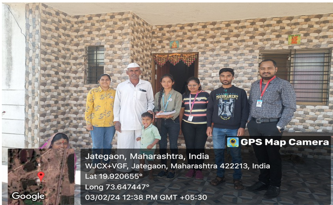
NSS volunteers with villagers

Village Survey – Population and voter registration survey was done by NSS volunteers VV