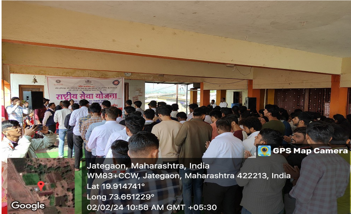
NSS volunteers doing NSS Prayer