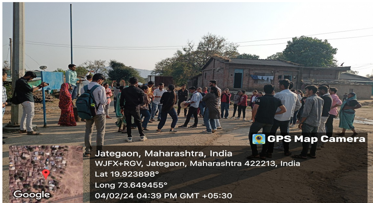
Street Play on Population Control